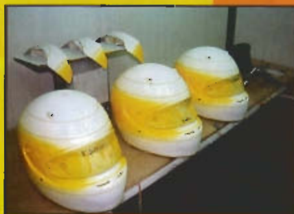
El primer color que se pinta es el amarillo. Se utiliza pintura acrílica de carrocería con sistema bicapa, normalmente de la marca Standox.