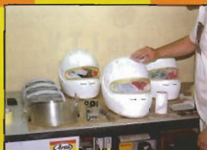
El primer paso que se realiza es eliminar todos los adhesivos y a continuación se "matiza" utilizando lija al agua de grano fino (800 pps)..