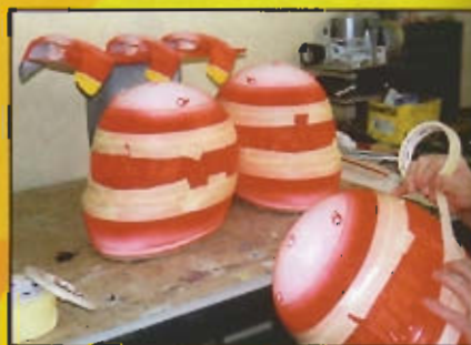
Protegemos con cinta el nuevo color aplicado para poder continuar trabajando en el diseño. Tened presente que, antes, la pintura debe de secarse.