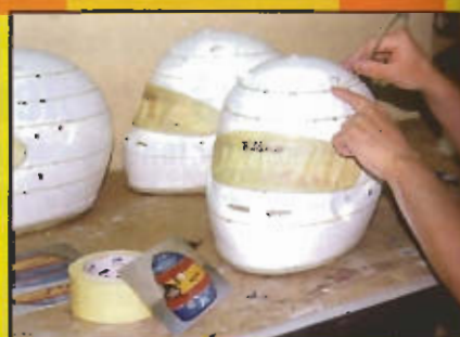
Luego se marcan todos los límites de cada color que presenta el diseño con cinta de enmascarar muy fina (1,5 mm).