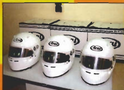
El casco de Alonso es un Arai modelo GP-5, el top de gama utilizado en la F1. Su precio ronda los 1.200 €, y se sirve en color blanco.